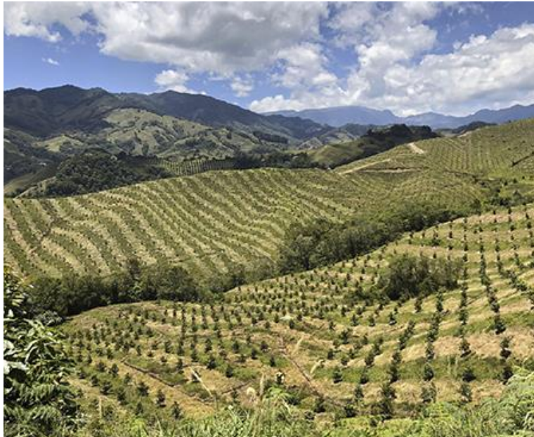
Cultivo de aguacate hass en Risarlda, Colombia.